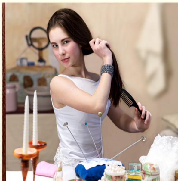
Д. Виноградова «За туалетом» (2018)