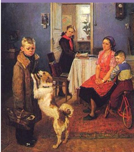
Фёдор Решетников «Опять двойка». 1952г.