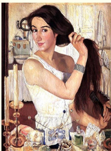
З. Серебрякова «За туалетом» (1909)